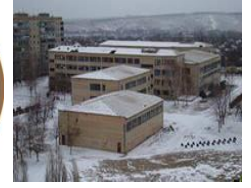
ДЮК ФП №2