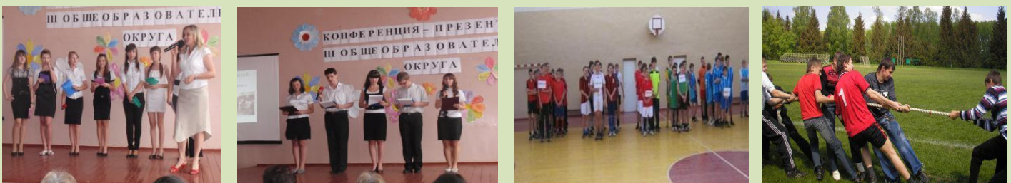
КОНКУРСИ «МАЙБУТНІЙ ВОЇНЬ», «ЄВРО -2012», «ВЕСЕЛІ СТАРТИ»,...