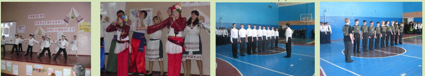
ТИЖНІ ПІСЕМНОСТІ, ФЕСТИВАЛЬ «ЧЕРВОНА КАЛИНА», БРЕЙН-РИНГИ, КОНФЕРЕНЦІЇ, ...