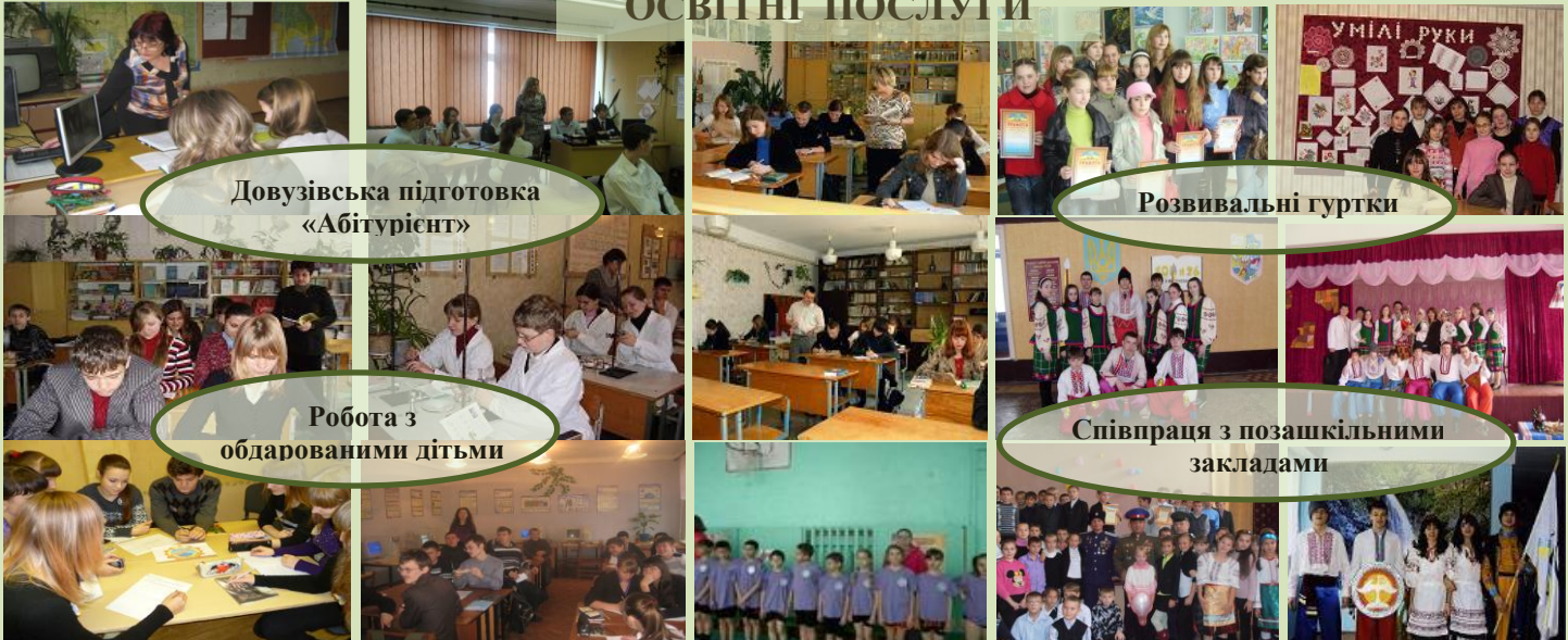
Довузівська підготовка «Абітурієнт»